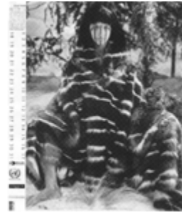
GABY HERBSTEIN 2012